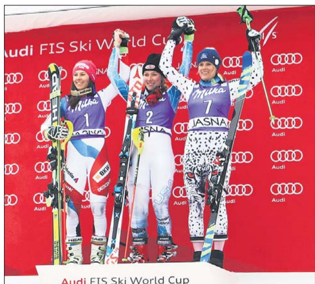
Audi FIS Ski World Cup