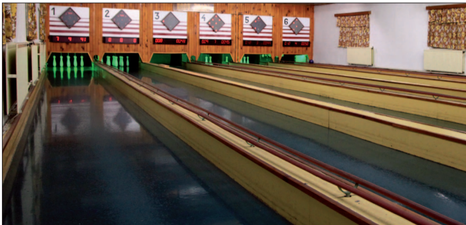
Dráhy sú udržiavané dobre, štandardom však už technicky nevyhovujú

ká je doba, mesto by sa o svoj kolkársky drahokam v Madarase malo starať viac. Kolkári si to určite zaslúžia... -ob-