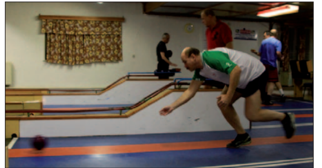
O kolky je v meste stále značný záujem. Neregistrovaní sa združujú v mestskej kolkárskej lige

tkov“ bez ktorej by tak úspešný šport, akým pre Spišskú Novú Ves kolky sú určite neprežil. A hoci si uvedomujeme aká ťaž-