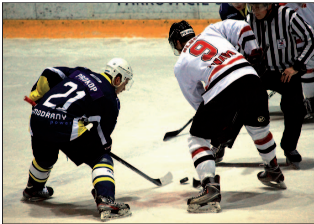
Hokejisti zatiaľ šliapu ako dobre namazaný stroj. Nájdu sa však financie na dôstojné vyvrcholenie ligy?