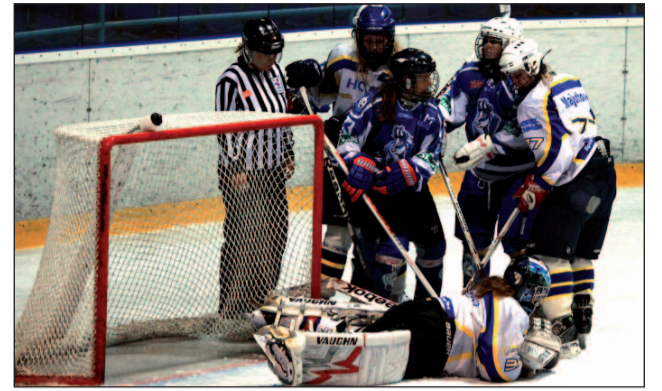
Osy zatiaľ dobodali všetko čo im prišlo do cesty a po roku si opäť brúsia žihadľu na titul.

dión sa postupne vracia divák. Cieľ ostáva zatiaľ nezmenený – postup do extraligy. Za častým slovom zatiaľ, hľadajte jedinú – financie....“