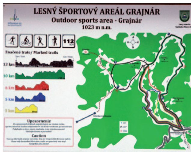
Vynovený lyžiarsky areál je určený pre všetky vekové kategórie