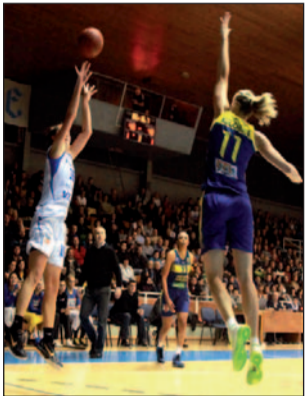
Na ženskú basketbalovú extraligu sa môže tešiť aj o rok. Bossovia ŠKBD Rucon popreli akékoľvek špekulácie o odchode.

V prvom čísle Spišského Patriota sme dopodrobna rozobrali stav, ciele a vyhliadky relevantných zväčša extraligových športov na Spiši. Skúsili sme sa zahrať i na novinársku Sibylu a zatípovať si ako to bude po sezóne vyzerat'. Ligy sa rozbehli a my sme sa do jednotlivých kuchýň pozreli opäť a sondaovali ako sú v kluboch spokojní s prebiehajúcou sezónou.