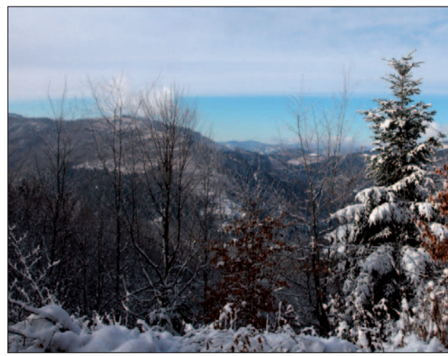
Trate ponúkajú aj takéto nádherné výhľady