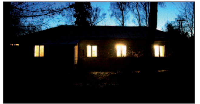
Kolkáreň postavená v 50 - tých by potrebovala finančnú injekciu.

My sme zo stretnutia s kolkármi odchádzali s dobrým pocitom. Opäť sme raz v „malom športe“ videli obrovskú zaoštieňosť a finančnú angažovanosť „fana-