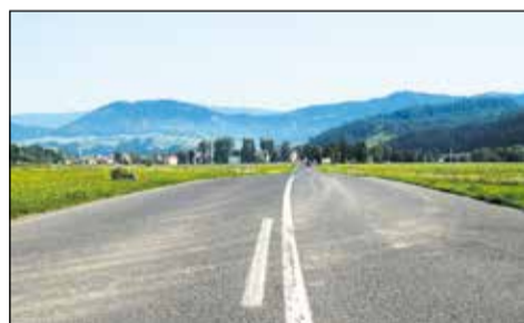
Spišská Stará Ves.

okolo Dunajca prinášajú do tejto oblasti peniaze. Tento bonus je ešte umocnený cez Európsku úniu projektom Interreg, cezhraničnou spolupracou Slovenska a Poľska, čo sa ukazuje najmä na cestách, ktoré sú, aj do „zapadnutých“ dediniek, v perfektnom stave. V Hanušovciach som odbočil vpravo,