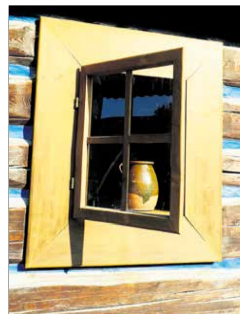
Typická zamagurská architektúra.

zvládne len rýchlik a to, čo tu vyviedli lesníci so svojou ťažkou technikou naozaj nepatrí do mapy turistických (a navyše aj cykloturistických) trás. Na tretí deň som sa chystal prejsť cez Kopské sedlo do Tatranskej Javoriny, ale keď som o piatej ráno stepoval na stanici a ozvalo sa obľúbené „Upozornenie na meškanie vlaku“, bola mi moja logistika spojov do Popradu a následne do Ždiaru už iba akurát na dve veci. A tak si tú trasu budem musieť pripojiť ku svojmu prechodu Vysokými Tatrami na budúce.