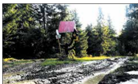
Turistická cesta na Magurke.

okolo Dunajca prinášajú do tejto oblasti peniaze. Tento bonus je ešte umocnený cez Európsku úniu projektom Interreg, cezhraničnou spolupracou Slovenska a Poľska, čo sa ukazuje najmä na cestách, ktoré sú, aj do „zapadnutých“ dediniek, v perfektnom stave. V Hanušovciach som odbočil vpravo,