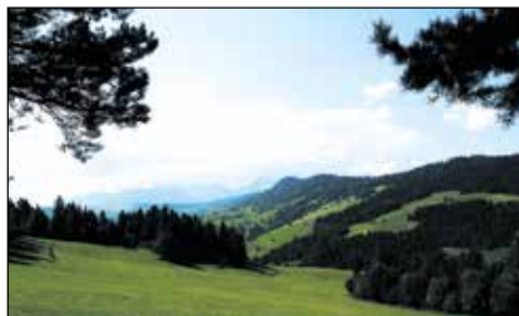
Zo sedla nad veľkou Frankovou.